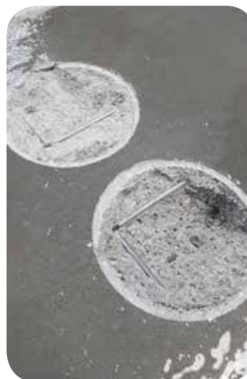
Teste de Arrancamento sobre base de concreto = 46 a 50 Kgf/cm 2 100% falha do concreto (ASTM D-4541)

Além dos substrato de concreto e metal, o Ureflex apresenta um ótimo desempenho para aplicação sobre tintas bi-componentes já existentes sobre a base.