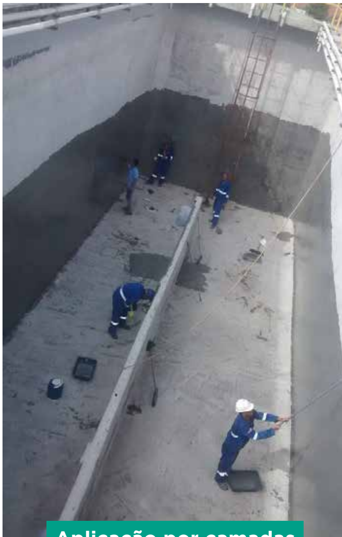
Aplicação por camadas