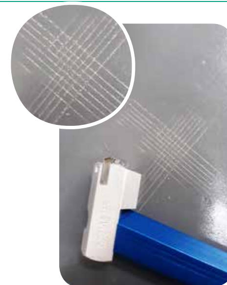
Teste de Adesão sobre chapas de aço = 0% de remoção 100% de aderência (ASTM D-3359)